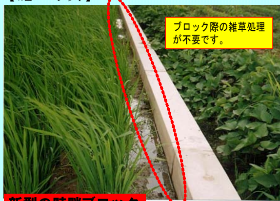
新型の畦畔ブロック